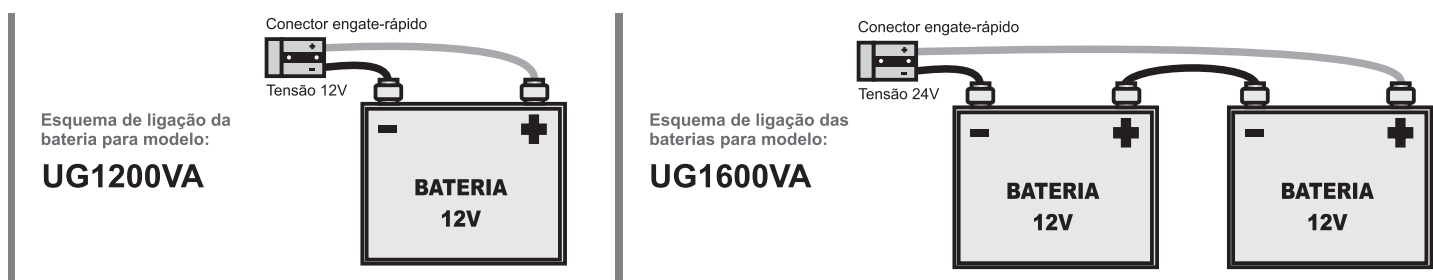
Diagrama de ligação das baterias:

O modelo PG 1600 trabalha com 2 baterias 12V fornecendo uma tensão de 24V ao Nobreak